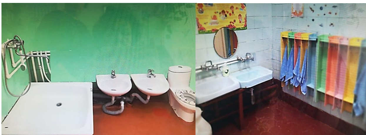
Фото № 7: Санитарно-гигиенические помещения

Комментарий к заключению: технические решения невозможны - организация альтернативной формы обслуживания