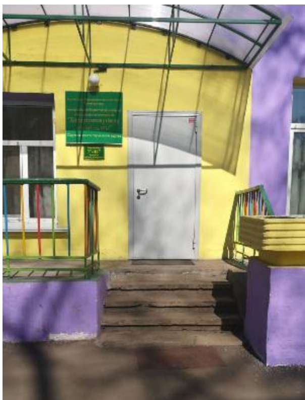
Фото №3, №4: Входы в здание

Комментарий к заключению: необходимо оборудовать горизонтальные поручни на входной двери, пандус на входе на территорию, а также установить кнопку вызова сотрудников для инвалидов колясочников