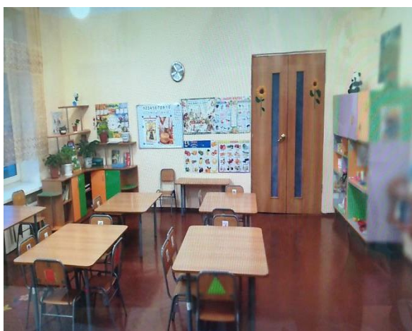
Фото №6: Кабинетная форма обслуживания

**указывается один из вариантов: не нуждается; ремонт (текущий, капитальный); индивидуальное решение с ТСР; технические решения невозможны – организация альтернативной формы обслуживания