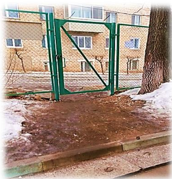
Фото №1: Вход на территорию 1