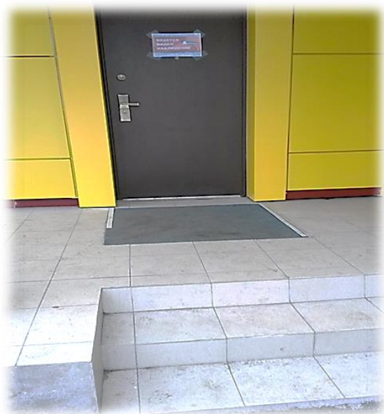
Фото №3, №4, №5: Входы в здание

Комментарий к заключению: необходимо оборудовать горизонтальные поручни на входной двери, пандус на входе на территорию, а также установить кнопку вызова сотрудников для инвалидов колясочников