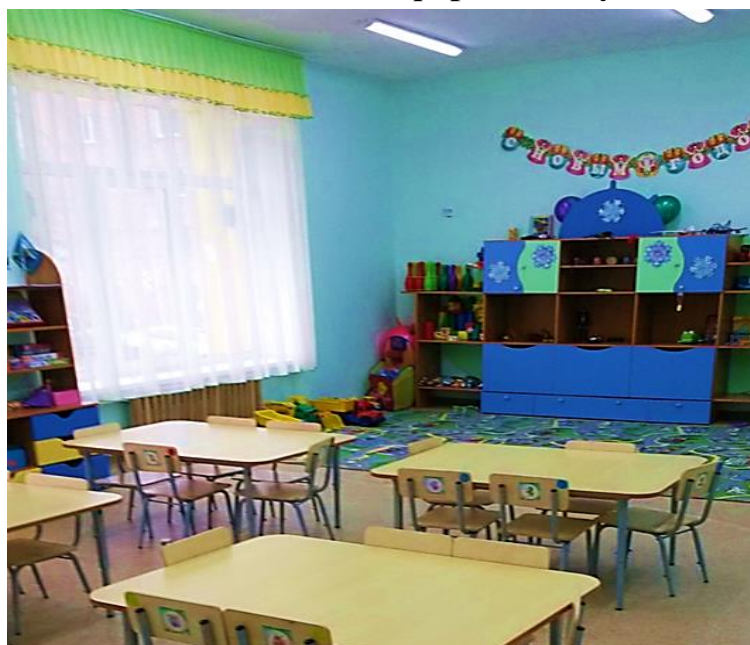
Фото №7: Кабинетная форма обслуживания

**указывается один из вариантов: не нуждается; ремонт (текущий, капитальный); индивидуальное решение с ТСП; технические решения невозможны – организация альтернативной формы обслуживания