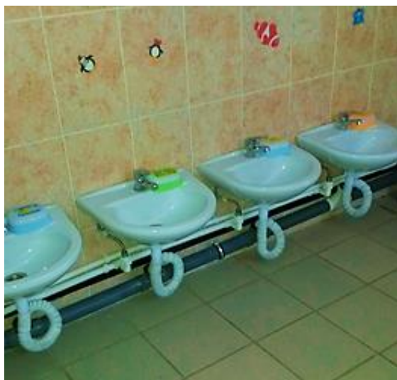
Фото № 8: Санитарно-гигиенические помещения

Комментарий к заключению: технические решения невозможны - организация альтернативной формы обслуживания